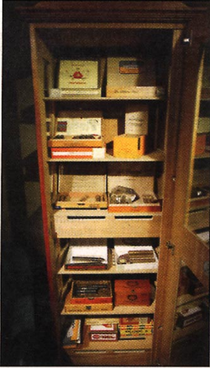
”Cigarrskåpet”. Här förvaras cigarrer-na.