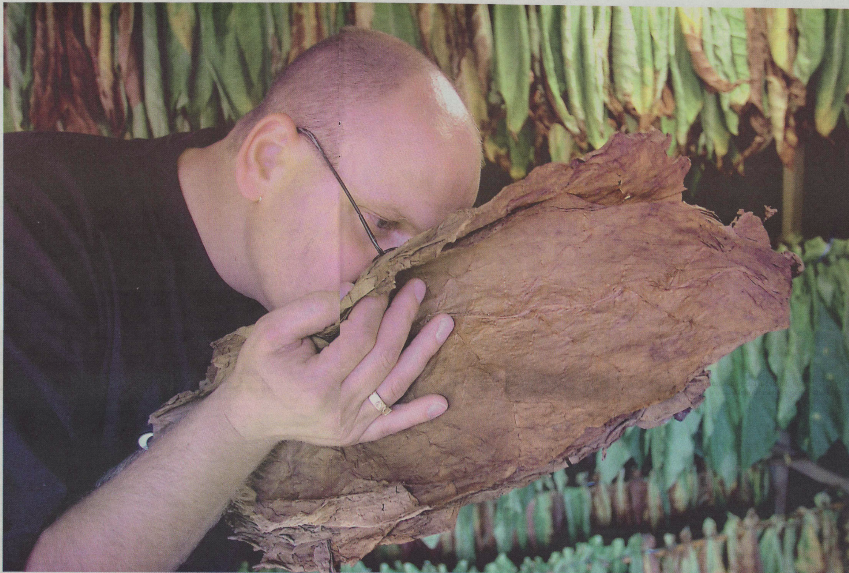
Med näsan direkt i en bunta tobaksblad sups doften in.