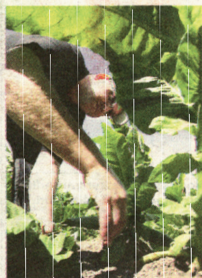
DYRT. Tre cigarrer av svenskt märke kostar 850 kronor.